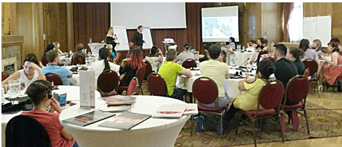
СВИТ-тренинг в Будапеште

СВАН увеличила процентное соотношение секс-работников в управляющем комитете, ввела специальные правила, чтобы секс-работники представляли СВАН на конференциях и встречах, пересмотрела политику подбора кадров и изъяла из нее требования, которые ставят секс-работников в заведомо проигрышное положение, и ввела разные типы членства, где только самоорганизации секс-работников или организации, полноценно вовлекающие секс-работников, могут голосовать.