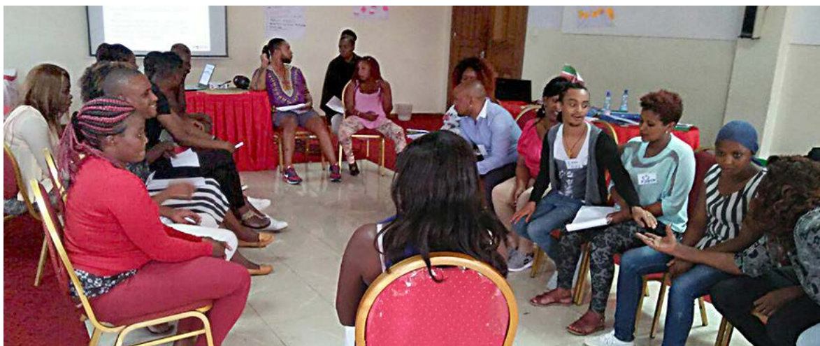
Участники третьей Академии для секс-работников Африки, 2017 г.

В ходе Академии в 2017 году команда из Танзании составила планы для адвокации в связи с финансированием Глобального фонда, и им удалось получить средства на организацию горячей линии для секс-работников. TASWA также успешно добилась включения основанных на правах программ для секс-работников в национальную заявку на финансирование, поданную в 2018 году.